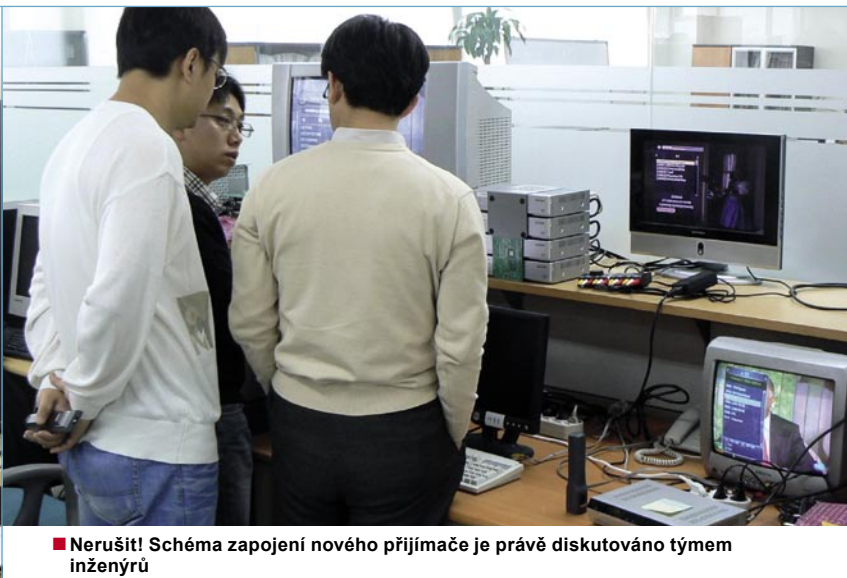
■ Nerušit! Schéma zapojení nového přijímače je právě diskutováno týmem inženýrů