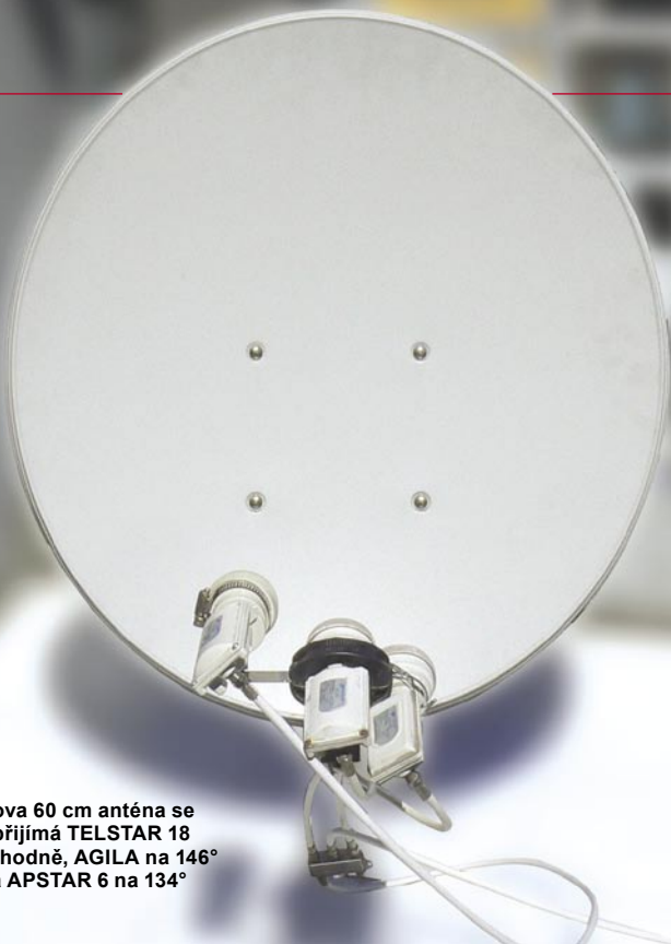
■ Applesatova 60 cm anténa se třemi LNB přijímá TELSTAR 18 na 138° východně, AGILA na 146° východně a APSTAR 6 na 134° východně.

Tento HDTV DXer vystupuje pod přezdívkou „Applesat“. Vysvětlil nám proč: „V patnácti letech jsem se začal zajímat o satelitní příjem. V té době byla Čína stále poněkud izolovaná a příjem zahraničních stanic mi tak otevřel zcela nový svět. Tenkrát jsem si myslel, že Země je jako jablko a satelity okolo ní létají.“