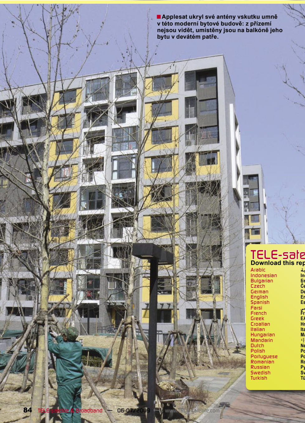
■ Applesat ukryl své antény vskutku umně v této moderní bytové budově: z přízemí nejsou vidět, umístěny jsou na balkóně jeho bytu v devátém patře.

V lednu 2009 se přestěhoval do vlastního bytu v novostavbě na severu Pekingu.