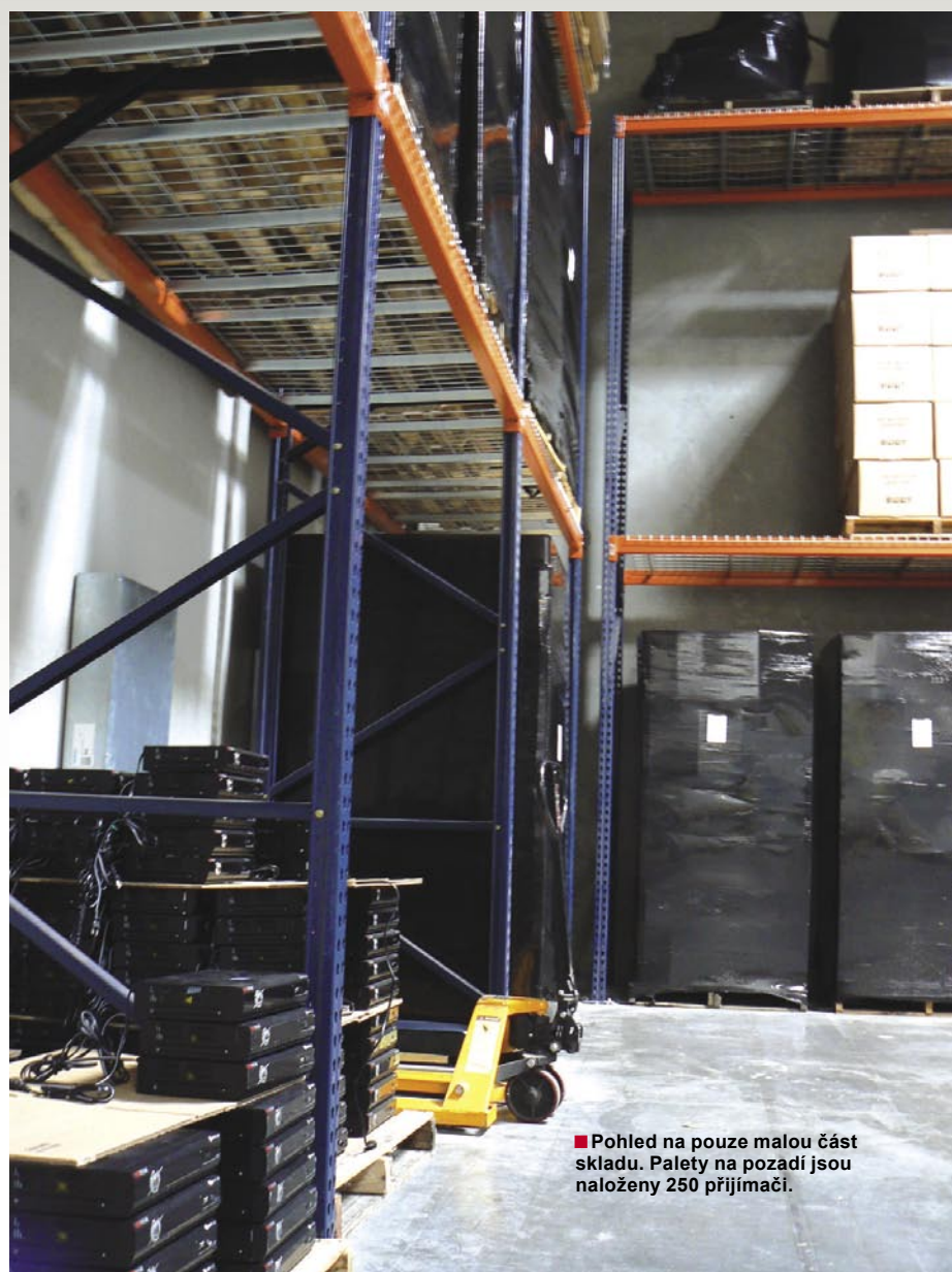
■ Pohled na pouze malou část skladu. Palety na pozadí jsou naloženy 250 přijímači.

Viewtech si posledních letech prošel poměrně slušným růstem: "V průměru