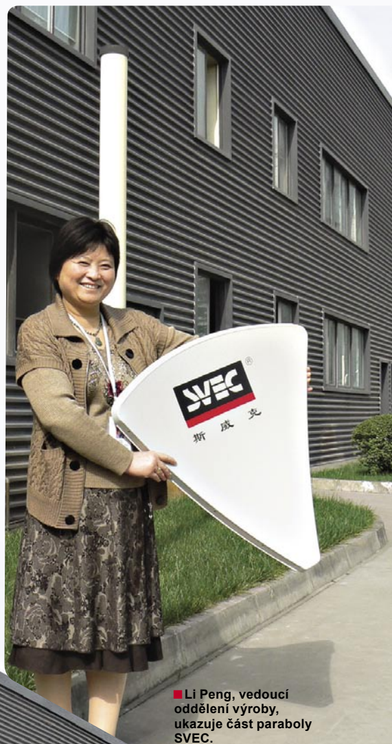
■ Pohled na gigantickou, 9000 metrů čtverečních rozlehlou výrobní halu. Nachází se tu celkem 15 lisovacích strojů na nichž se vyrábí paraboly od 35 cm až po 3 metry v průměru.

Prototyp systému je nainstalován v minivanu a během jízdy se testuje satelitní příjem, což je pro firemního řidiče velmi zajímavá náplň práce. Jako pasažérům tohoto vozu, značně udiveným z