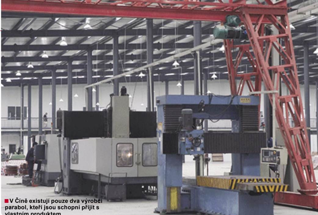
■ V Číně existují pouze dva výrobci parabol, kteří jsou schopni přijít s vlastním produktem.