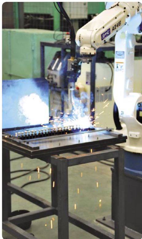
■ Při výrobě podpůrných tyčí jsou používány automatické svařovací roboty.

Ta Sichuanská ostrá omáčka se vaří u SVEC!