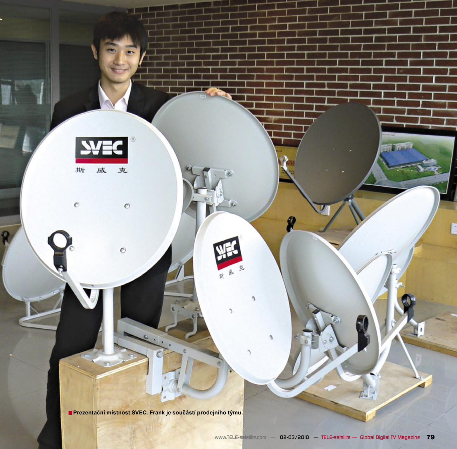
■ Prezentační místnost SVEC. Frank je součástí prodejního týmu.