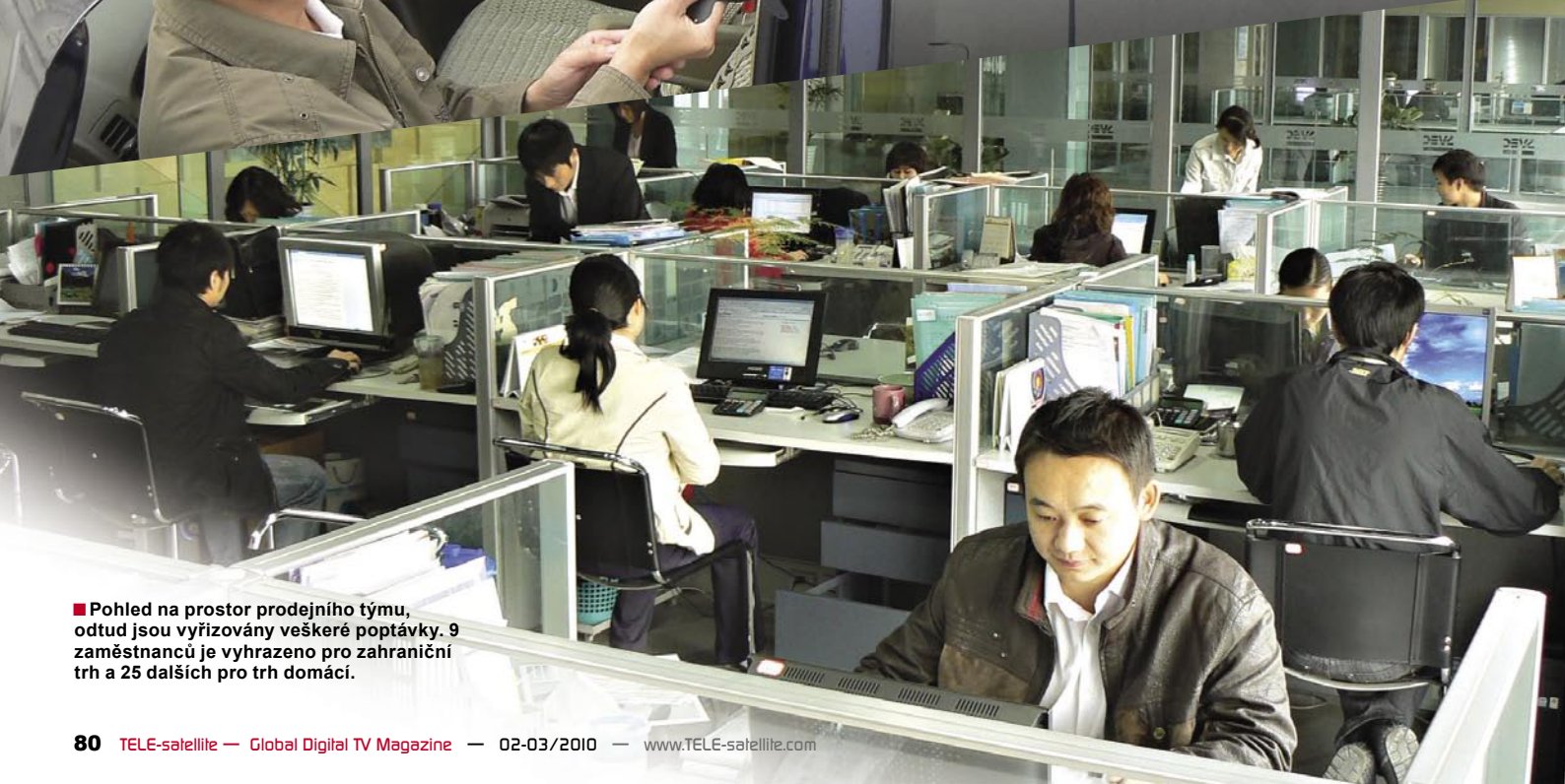
■ Pohled na prostor prodejního týmu, odtud jsou vyřizovány veškeré poptávky. 9 zaměstnanců je vyhrazeno pro zahraniční trh a 25 dalších pro trh domácí.