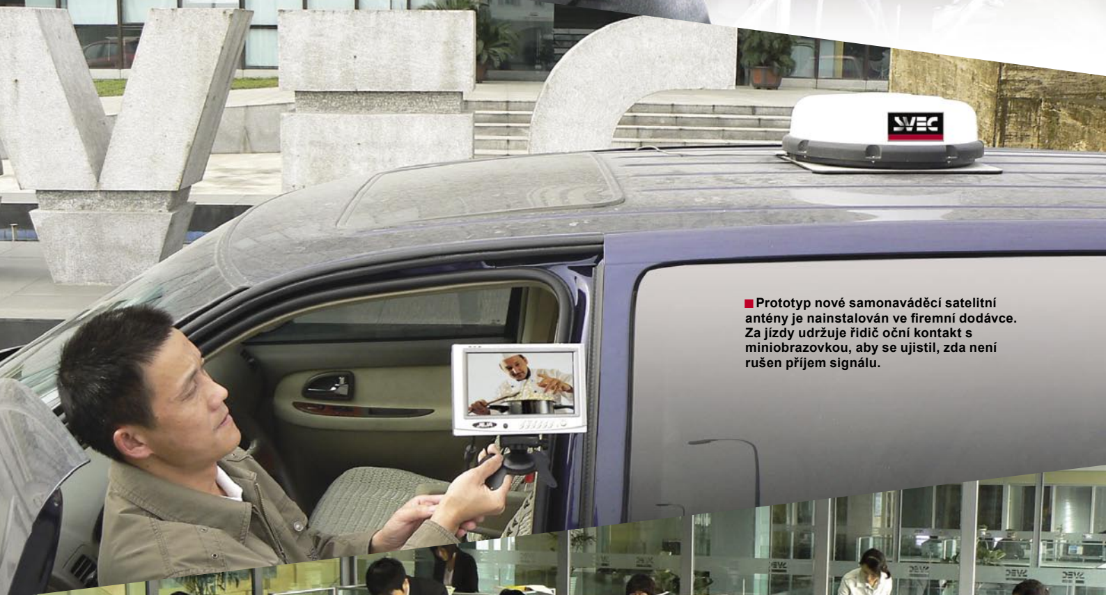
■ Prototyp nové samonaváděcí satelitní antény je nainstalován ve firmní dodávce. Za jízdy udržuje řidič oční kontakt s miniobrázkovkou, aby se ujistil, zda není rušen příjem signálu.