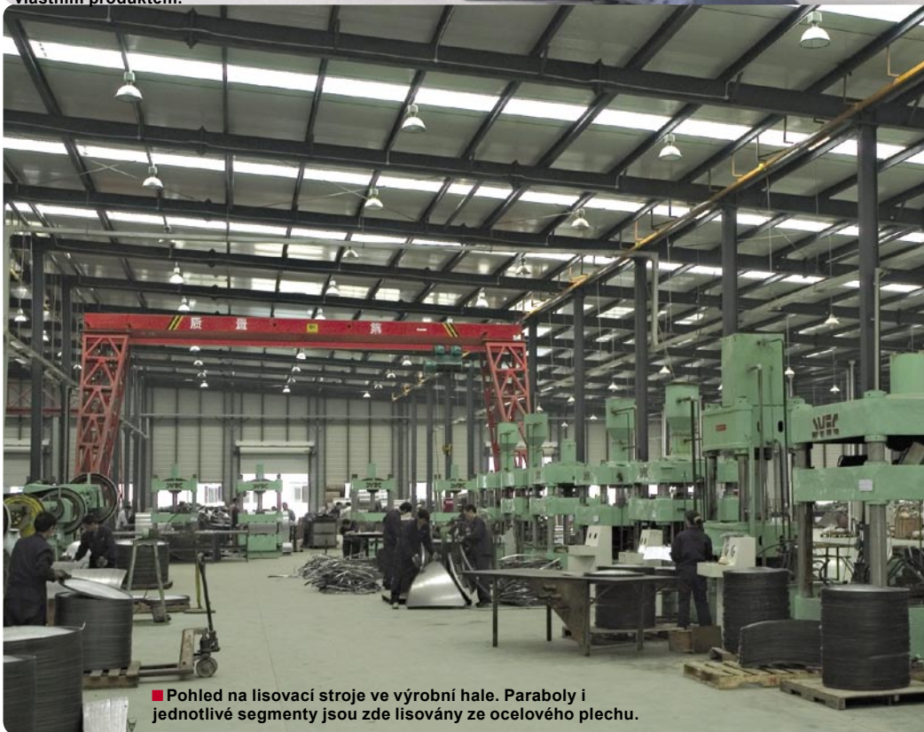
■ Pohled na lisovací stroje ve výrobní hale. Paraboly i jednotlivé segmenty jsou zde lisovány ze ocelového plechu.