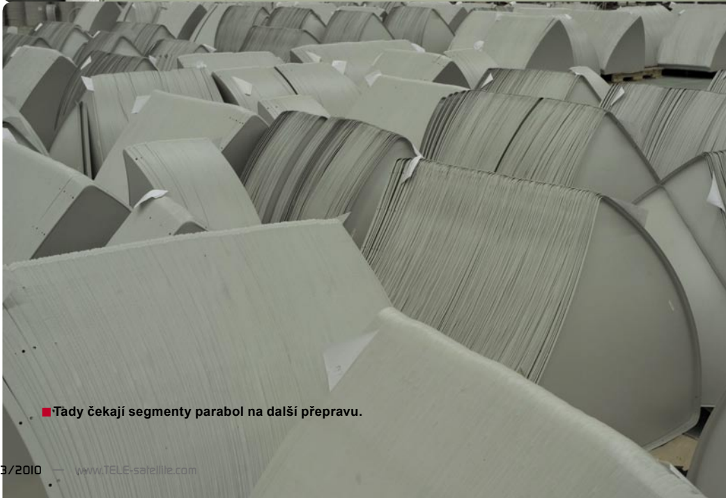
■ Tady čekají segmenty parabol na další přepravu.