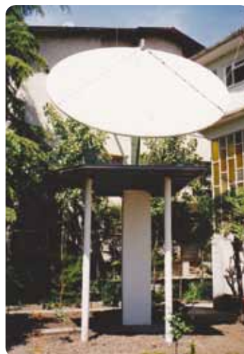
■ Hotovo! Anténa je na místě