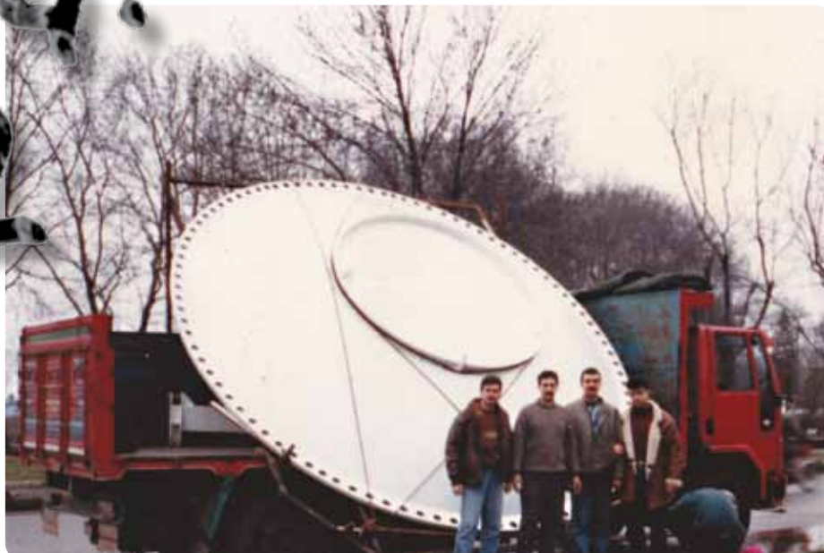
■ Anténa byla dovezena na místo nákladním automobilem