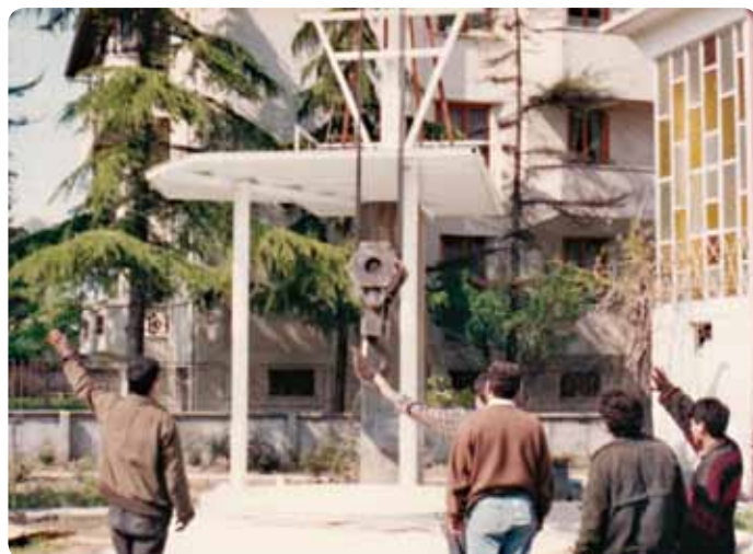
■ Pomocí jeřábu bude usazena parabola