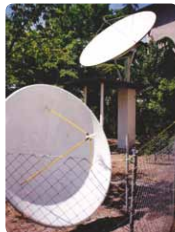
■ Menší 1,5 m parabolu v pozadí používá Cahit pro příjem ASTRY 2 na pozici 28,2 východně