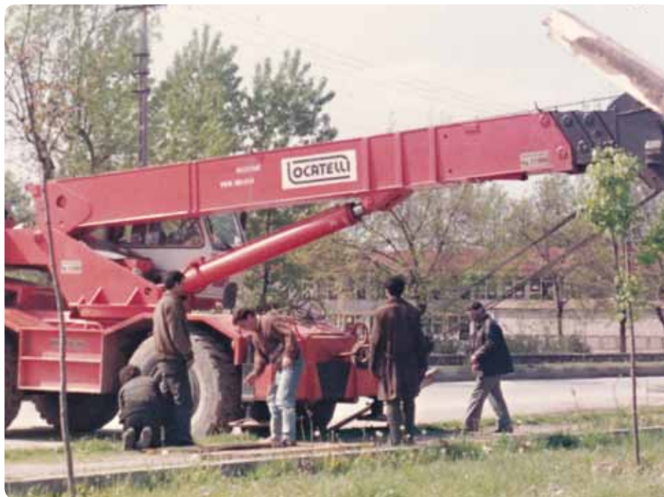
■ Příprava jeřábu