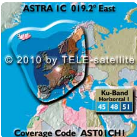
■ Jedna z mapek pokrytí ASTRA 1 na 19.2° východně. Příjem v Turecku není možný, dokud si neporadíte takové monstrum, jako má Cahit

Cahitovi se značné finanční náklady rozhodně vyplatily, nyní je schopen přijímat všechny požadované kanály ve špičkové kvalitě.