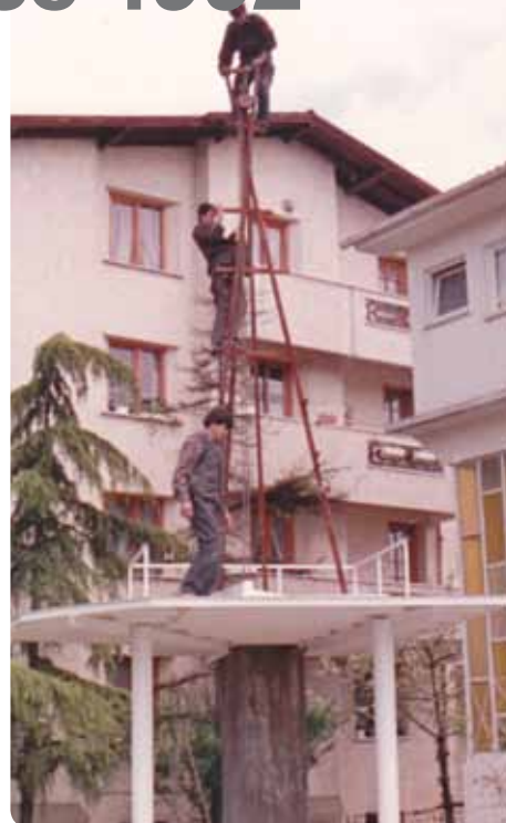
■ Příprava montážního rámu